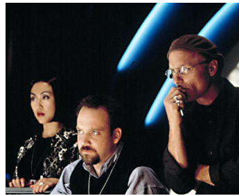
1998 THE TRUMAN SHOW (The Truman Show) de Peter Weir avec Paul Giamatti