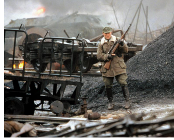
2001 STALINGRAD (Enemy at the Gates) de Jean-Jacques Annaud