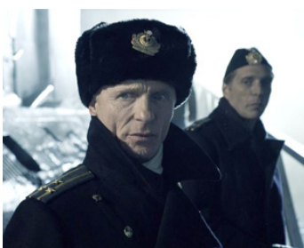
2013 PHANTOM (Phantom) de Todd Robinson avec William Fichtner