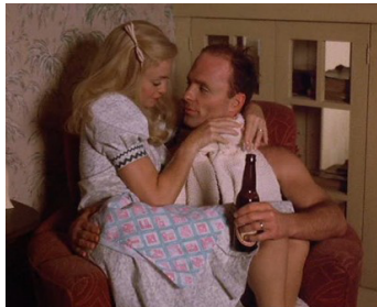
1984 SWING SHIFT (Swing Shift) de Jonathan Demme avec Goldie Hawn