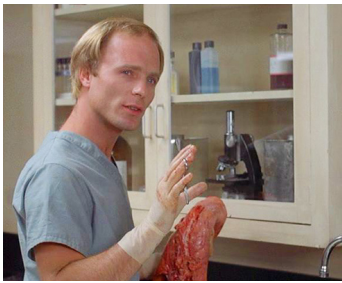
1978 MORTS SUSPECTES (Coma) de Michael Crichton