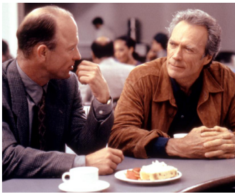
1997 LES PLEINS POUVOIRS (Absolute Power) de Clint Eastwood avec Clint Eastwood