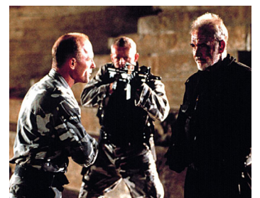
1996 ROCK (Rock) de Michael Bay avec David Morse, Sean Connery