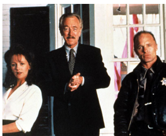
1993 LE BAZAAR DE L'ÉPOUVENTE (Needful Things) de Fraser Heston avec B. Bedelia, M. von Sydow