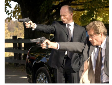
2005 A HISTORY OF VIOLENCE (History of Violence) de D.Cronenberg avec Peter MacNeill