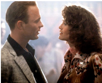
1985 SWEET DREAMS (Sweet Dreams) de Karel Reisz avec Jessica Lange