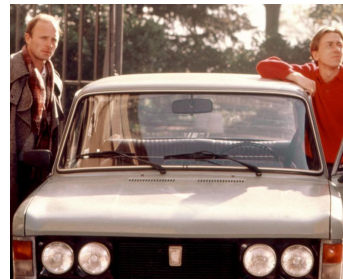
1988 LE COMLOT (To kill a Priest) d'Agnieszka Holland avec Tim Roth