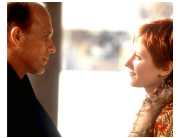
1999 AU CŒUR DU MIRACLE (The Third Miracle) d'Agnieszka Holland avec Anne Heche