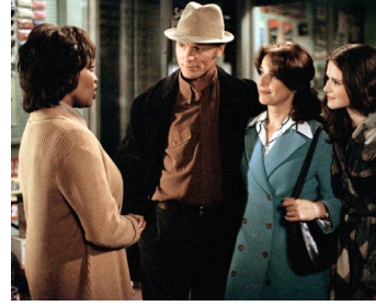
2003 RADIO (Radio) de Michael Tollin avec Alfred Woodard, Debra Winger, Sarah Drew