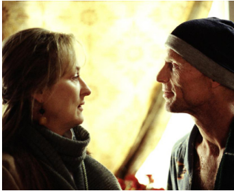
2002 THE HOURS (The Hours) de Stephen Daldry avec Meryl Streep