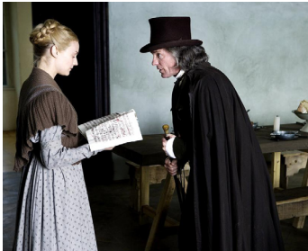
2006 COPYING BEETHOVEN (Copying Beethoven) d'Agnieszka Holland avec Diane Kruger