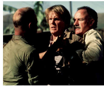
1983 UNDER FIRE (Under Fire) de Roger Spottiswoode avec Nick Nolte, Gene Hackman