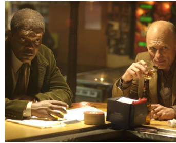
2008 CLEANER (Cleaner) de Renny Harlin avec Samuel L. Jackson