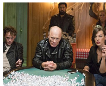
2014 CYMBELINE (Cymbeline) de Michael Almercyda avec Anton Yelchin, Milla Jovovich