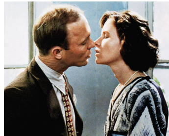
1984 LES SAISONS DU CŒUR (Places in the Heart) de Robert Benton avec Lindsay Crouse