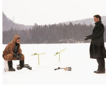
2003 LA COULEUR DU MENSONGE (The Human Stain) de Robert Benton avec Gary Sinise