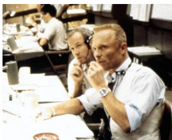
1995 APOLLO 13 (Apollo 13) de Ron Howard avec Clint Howard