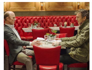
2015 NIGHT RUN (Run all Night) de Jaume Collet-Serra avec Liam Neeson