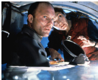
1989 ABYSS (The Abyss) de James Cameron avec Mary Elizabeth Mastrantonio