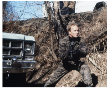
1980 CHICANOS, CHASSEUR DE TÊTES (Borderline) de Jerrold Freeman