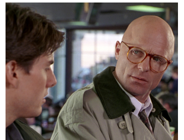
1993 LA FIRME (The Firm) de Sydney Pollack avec Tom Cruise