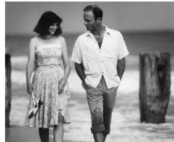
1984 A FLASH OF GREEN (A Flash of Green) de Victor Nuñez avec Blair Brown