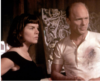
2000 POLLOCK (Pollock) d'Ed Harris avec Marcia Gay Harden