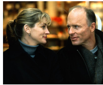
1998 MA MEILLEURE ENNEMIE (Stepmom) de Chris Columbus avec Julia Roberts