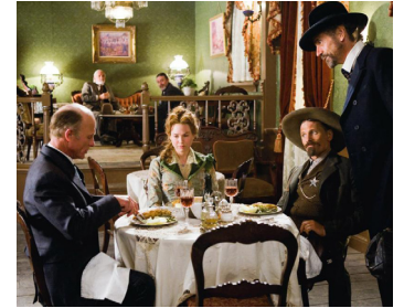
2008 APPALOOSA (Appaloosa) d'Ed Harris avec Renee Zellweger, Viggo Mortensen, Jeremy Irons