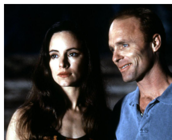
1994 LUNE ROUGE (China Moon) de John Bailey avec Madeleine Stowe