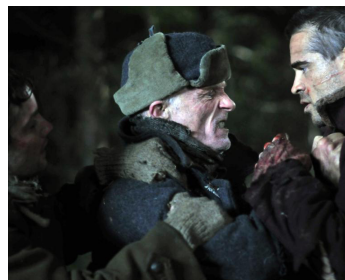
2010 LES CHEMINS DE LA LIBERTÉ (The Way Back) de Peter Weir avec Jim Sturgess, Colin Farrell