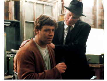
2001 UN HOMME D'EXCEPTION (A Beautiful Mind) de Ron Howard avec Russell Crowe