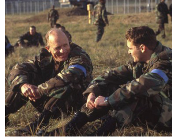
2001 BUFFALO SOLDIERS (Buffalo Soldiers) de Gregor Jordan avec Joaquin Phoenix