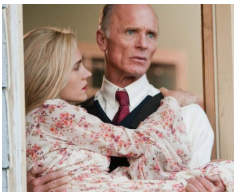
2010 VIRGINIA (What's wrong with Virginia ?) de Dustin Lance Black avec Jennifer Connelly