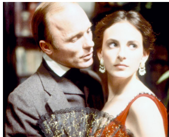
1987 WALKER (Walker) d'Alex Cox avec Marlee Matleen