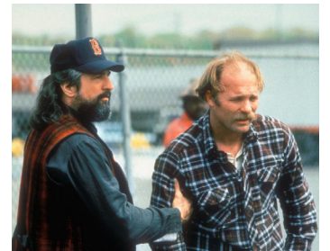
1989 JACKNIFE (Jacknife) de David Hugh Jones avec Robert De Niro