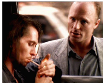
1990 LES ANGES DE LA NUIT (State of Grace) de Phil Joanou avec Gary Oldman