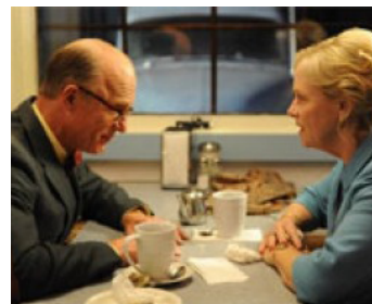
2011 THAT'S WHAT I AM (That's What I Am) de Michael Pavone avec Amy Madigan