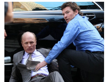
2012 DOS AU MUR (Man on a Ledge) d'Asger Leth avec Sam Worthington