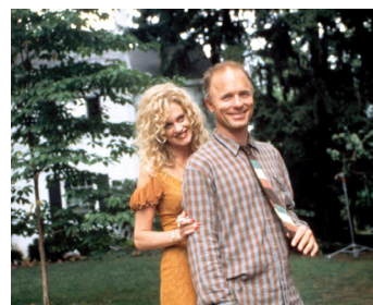
1994 LA SURPRISE (Milk Money) de Richard Benjamin avec Melanie Griffith