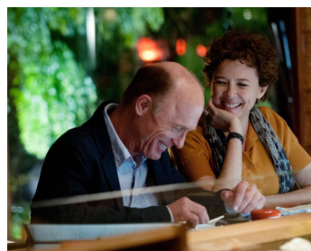
2014 THE FACE OF LOVE d'Arie Posin avec Annette Bening