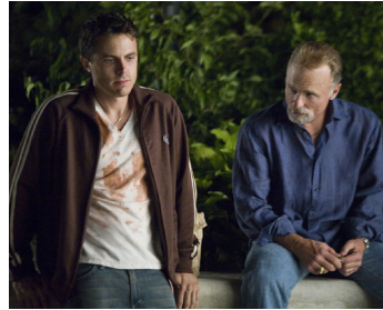
2007 GONE BABY GONE (Gone Baby Gone) de Ben Affleck avec Casey Affleck