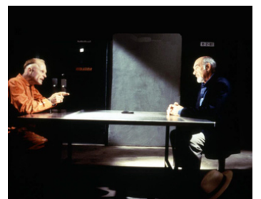
1995 JUSTE CAUSE (Just Cause) d'Arne Glimcher avec Sean Connery