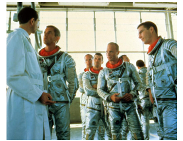
1983 L'ÉTOFFE DES HÉROS (The Right Stuff) de Ph. Kaufman avec F. Ward, S. Glenn, D. Quaid