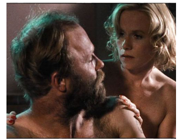
1985 ALAMO BAY (Alamo Bay) de Louis Malle avec Amy Madigan