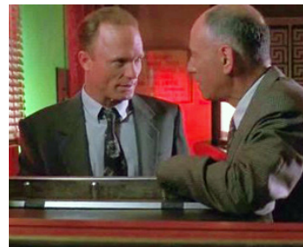
1992 GLENGARRY (Glengarry Glen Ross) de James Foley avec Alan Arkin